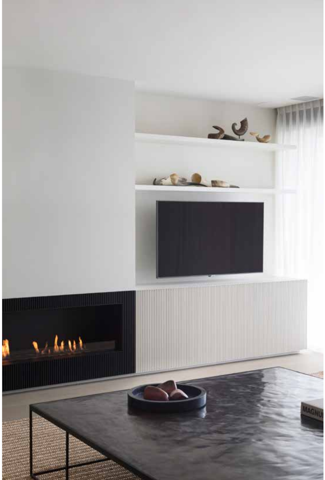
De gashaard is van GlammFire en werd afgewerkt door de firma Luypaert Interieur. Deze interieurfirma maakte al het vaste timmerwerk en de keuken perfect op maat in haar eigen atelier in Wevelgem.