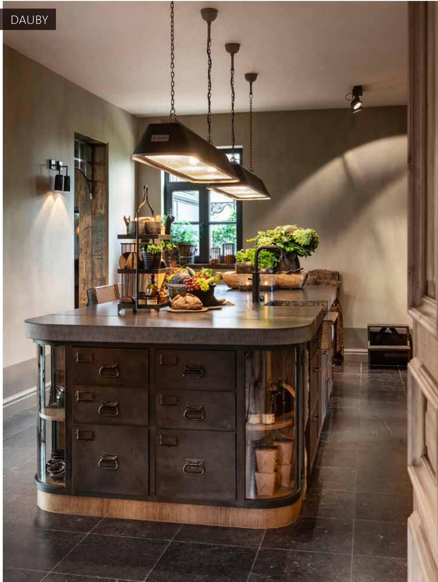
Tekst: Anja Bernelen