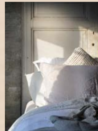
Dekbedovertrek en kussenslopen Pistoia (249,95 euro, houseinstyle.nl ), grof gehaakt kussen Manchester (79,95 euro, houseinstyle.nl )