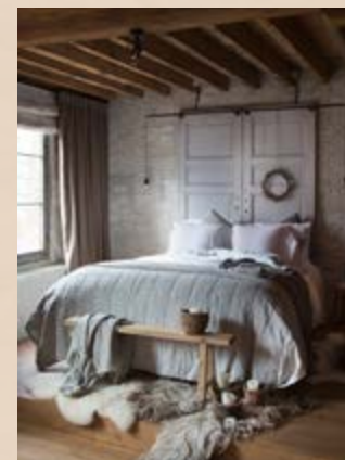
Gordijnroedes en ijzeren staaf met verlichting boven bed (prijzen op aanvraag, dauby.be ), schapenvachten (vanaf 89 euro, vachtvanvilt.nl ), plaid op bankje (119 euro, bymolle.com ), spreij Nice met stiksels (209,95 euro, houseinstyle.nl ), dekbedlinnen en kussenslopen Pistoia (249,95 euro, houseinstyle.nl ), bankje (eigendom styliste), houten kommen (25 euro, facebook.com/landelijkwonenbylie )