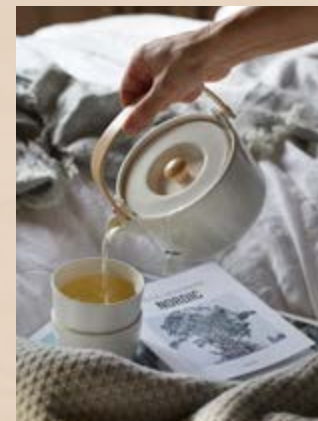
Onderste plaid van gerecycled denim (119 euro, bymolle.com ), bovenste plaid van merinowol (119 euro, bymolle.com ), theekan Marimekko

(75 euro, moose-in-the-city.com ), theekop Marimekko (14 euro, moose-in-the-city.com ), boek Rock The Shack (39,90 euro, moose-in-the-city.com ), boek Instagrammar - nordic (14,99 euro, moose-in-the-city.com )