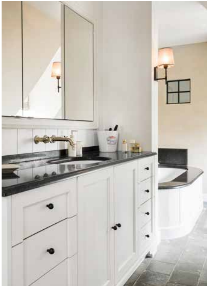
Zicht op de ouderlijke badkamer met ligbad ingewerkt in verzoete blauwe steen en wastafels. Opnieuw is elke vierkante meter benut met op maat gemaakte, ingewerkte kasten en zitbankjes. De vloer is een antieke terracottategel.