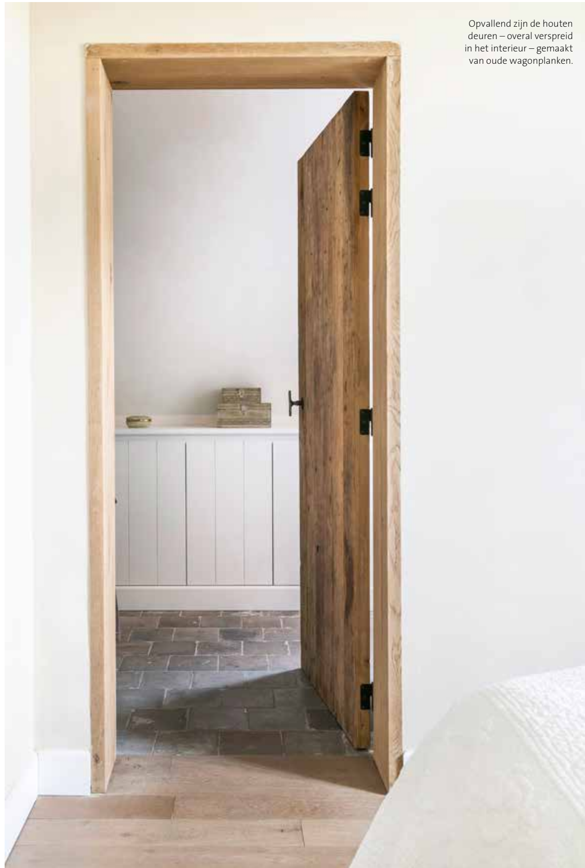
Opvallend zijn de houten deuren – overal verspreid in het interieur – gemaakt van oude wagonplanken.

“Dankzij de oude materialen denk je dat het een gerenoveerde, authentieke hoeve is”