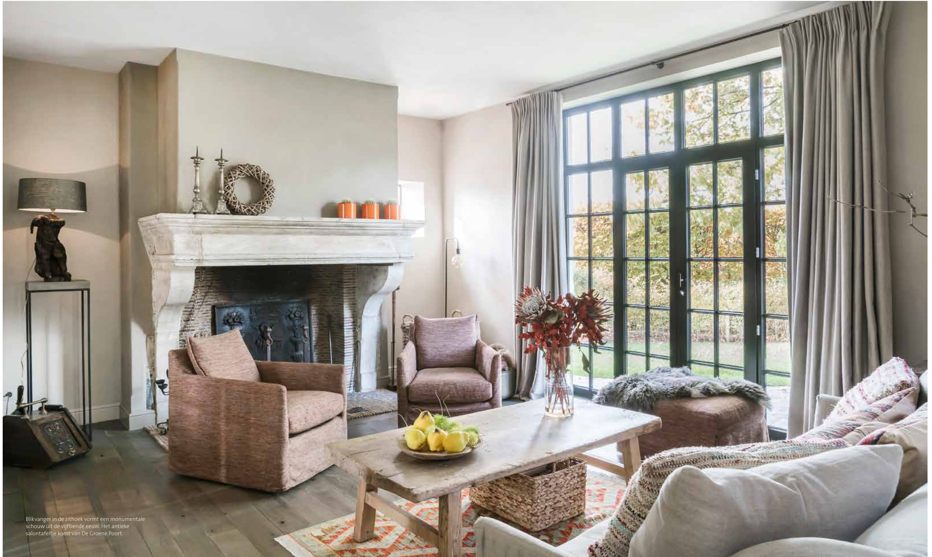
Blikvanger in de zithoek vormt een monumentale schouw uit de vijftiende eeuw. Het antieke salontafeltje komt van De Groene Poort.