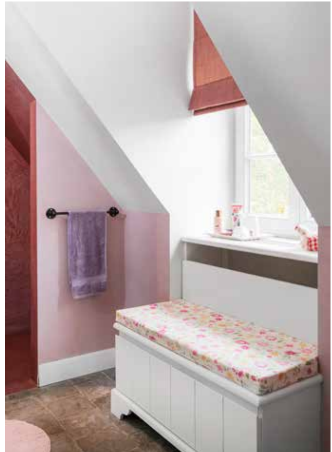
De inloepdouche in de badkamer van de kinderen is uitgevoerd in zachtroze mortex. Elke vierkante meter is benut onder de schuine zijde van het dak met ingewerkte kasten en een handig zitbankje. De vloer bestaat uit een antieke terracottategel.

“In alle ruimtes hebben we elke vierkante meter optimaal benut”