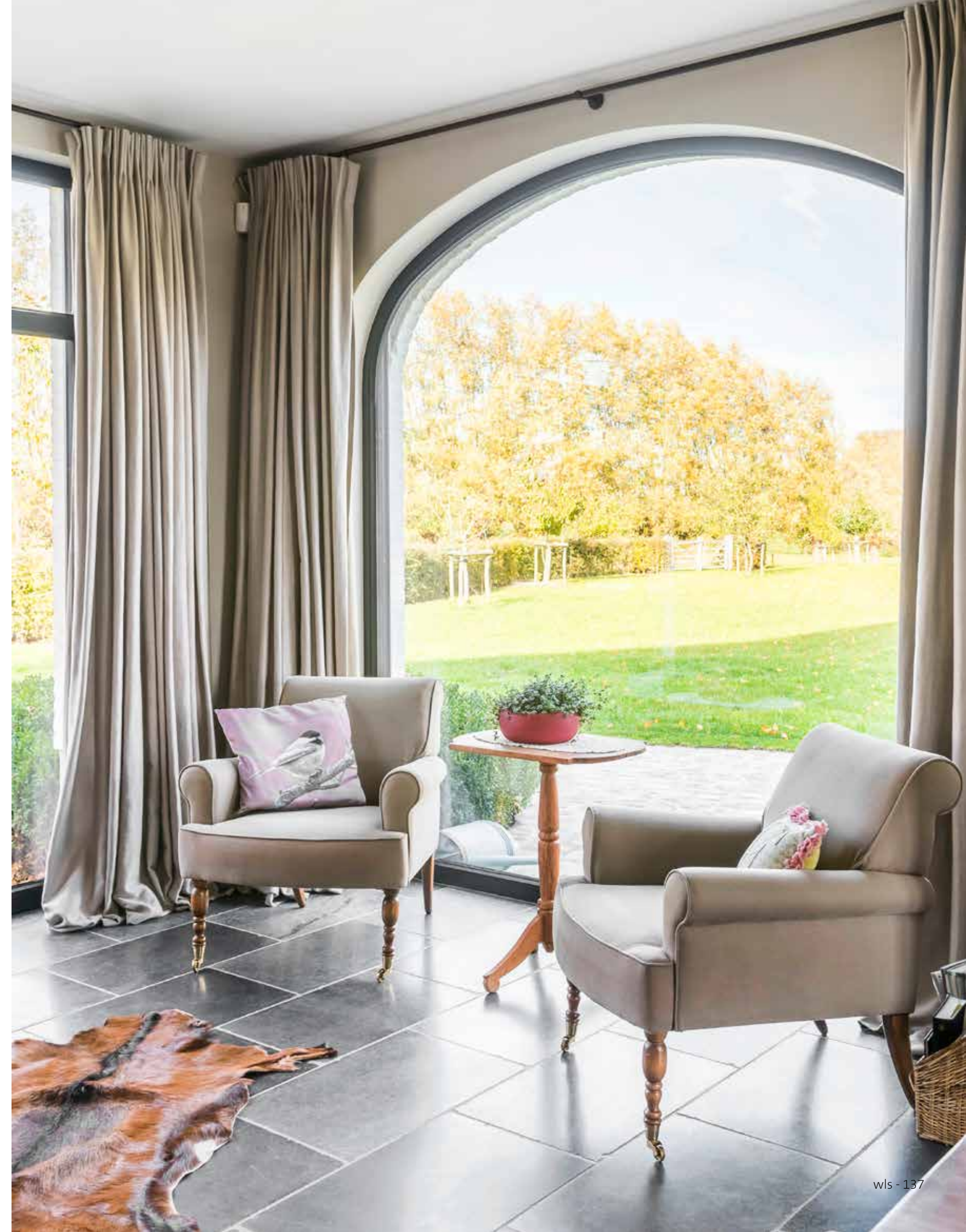
Heel het interieur, waaronder de keuken, werd in samenspraak met Emmely en Jo volledig op maat uitgetekend. Vervolgens voerden ervaren vaklui dit minutieus uit.